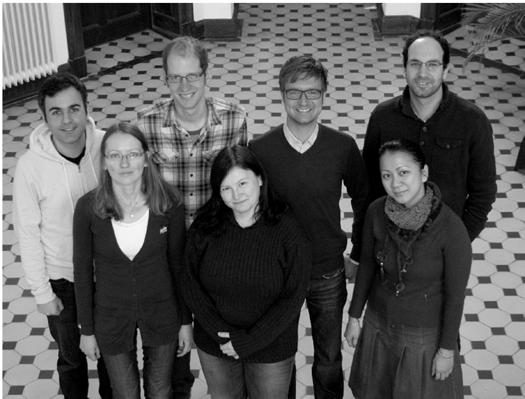
Doktorandinnen und Doktoranden am IFSH