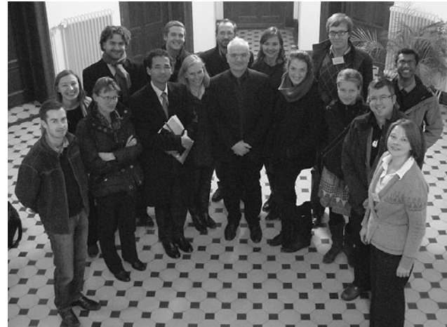
Die Teilnehmer/-innen des Workshops im IFSH

Panel I reflektierte theoretische und methodologische Aspekte normativen Argumentierens staatlicher Akteure im Bereich der Terrorismusbekämpfung, Panel II untersuchte die Argumente zur Legitimierung des „War on Terrorism“ und von Folter bzw. folterähnlichen Methoden. Panel III verglich das Überzeugungsargumentieren staatlicher Akteure (USA, Großbritannien, Russland), und Panel IV fragte nach den Konsequenzen normativen Argumentierens im Bereich der Terrorismusbekämpfung auf die Geltung verbrieft internationaler Menschenrechtsnormen. Abschließend wurden die