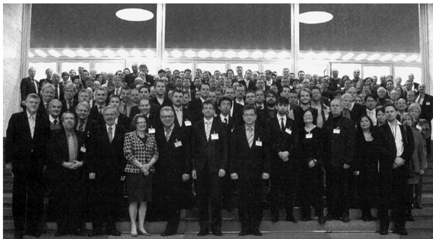
Die TeilnehmerInnen der CyberSecurity-Konferenz in Berlin

Das IFSH organisierte zusammen mit dem Auswärtigen Amt, der FU Berlin und dem Institut der Vereinten Nationen für Abrüstungsforschung in Genf (UNIDIR) am 13. und 14. Dezember 2011 in Berlin eine internationale Konferenz zum Thema Cyber-Sicherheit. Vertreter und Vertreterinnen verschiedener Regierungen (u.a. der USA, Russlands, der Europäischen Union und Chinas), der Wissenschaft, der Industrie und der Zivilgesellschaft diskutierten zwei Tage verschiedene Aspekte unter dem Titel „Challenges in Cyber Security - Risks, Strategies, and Confidence-Building“. Ziel der Veranstaltung war es, einen Meinungsaustausch staatlicher wie nichtstaatlicher Akteure zum Thema „Cyberwar“ zu ermöglichen und die Konsequenzen künftiger Bedrohungen zu diskutieren. Darüber hinaus sollten erste vertrauensbildende Maßnahmen auf internationaler Ebene erarbeitet werden.