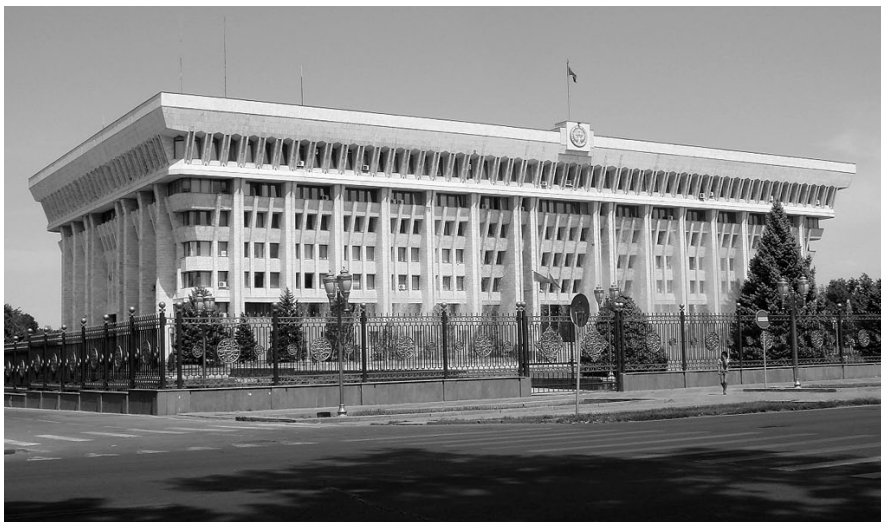
Das „Weiße Haus“ der Regierung in Bischkek

Im November 2011 führte Frank Evers in Bischkek (Kirgisistan) Gespräche mit etwa 20 kirgisischen Regierungsvertreter/-innen, Mitarbeitern der OSZE, Diplomaten und Akademikern. Thema waren Erfahrungen im OSZE-Konfliktmanagement während der zwei kirgisischen Krisen im April und Juni 2010.