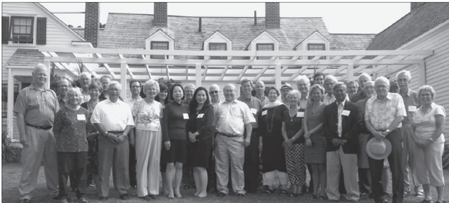
Gruppenfoto der Pugwash-Konferenz vor der Sommervilla von Cyrus Eaton, wo im Juli 1957 die erste Pugwash-Konferenz stattfand.

Der Beauftragte der Bundesregierung für Fragen der Abrüstung und Rüstungskontrolle veranstaltete am 11. September 2012 im Auswärtigen Amt einen Meinungsaustausch zu aktuellen abrüstungs- und nichtverbreitungspolitischen Perspektiven, zu dem Mi-