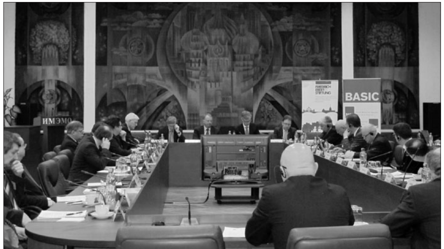
Konferenz in Moskau: Der Veranstaltung in Moskau wurde von der Friedrich-Ebert-Stiftung mitgetragen und fand vor dem Hintergrund des bevorstehenden NATO-Gipfels in Chicago statt.

Auch der auf dem Gipfel in Chicago im Mai 2012 angenommene DDPR-Report brachte keine substanziellen Fortschritte. Allerdings einigte sich die NATO darauf, einen neuen