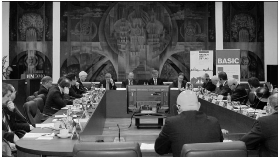
Konferenz in Moskau: Der Veranstaltung in Moskau wurde von der Friedrich-Ebert-Stiftung mitgetragen und fand vor dem Hintergrund des bevorstehenden NATO-Gipfels in Chicago statt.

Auch der auf dem Gipfel in Chicago im Mai 2012 angenommene DDPR-Report brachte keine substanziellen Fortschritte. Allerdings einigte sich die NATO darauf, einen neuen