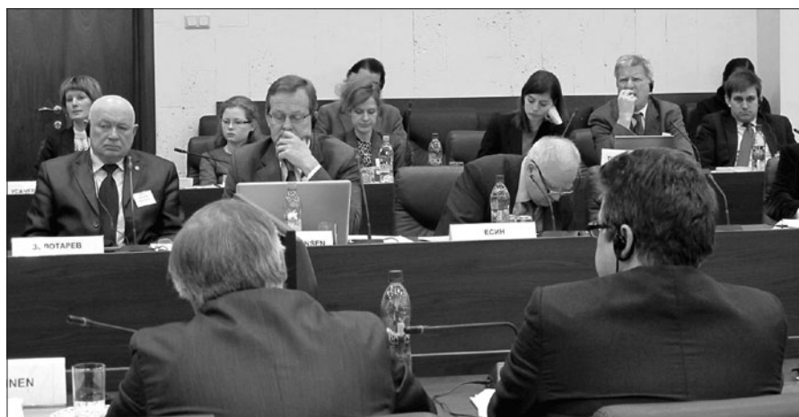
Konferenz in Moskau: Mehr als 70 Teilnehmerinnen und Teilnehmer debattierten am 12. März 2012 auf einer vom IFSH mit organisierten Konferenz über „Taktische Atomwaffen und der NATO-Russland Dialog“ am Institut für Weltwirtschaft und Internationale Beziehungen (IMEMO) in Moskau.

Im Juli 2012 hat die William and Flora Hewlett Foundation ihre Förderung des Projekts über eine Reduzierung der Rolle taktischer Atomwaffen in der europäischen Sicherheit zum zweiten Mal verlängert. Damit geht das vom IFSH in Zusammenarbeit mit der amerikanischen Arms Control Association und dem British American Security Information Council gemeinsam durchgeführte Vorhaben nun in das dritte Jahr. Neben der Diskussion über eine Reform der sogenannten nuklearen Teilhabe in der NATO wird es künftig verstärkt auch darum gehen, Möglichkeiten der kooperativen Reduzierung taktischer Atomwaffen mit Russland herauszuarbeiten.