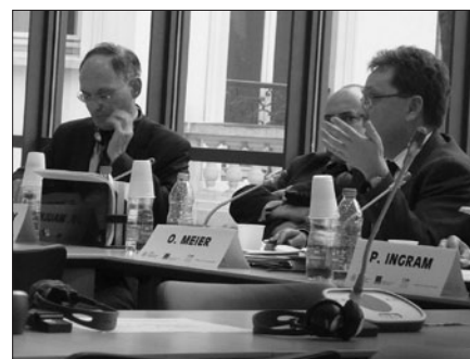
Konferenz in Paris: Am 5. und 6. März 2012 diskutierten mehr als 30 Diplomaten, NATO-Mitarbeiter und Experten am Institut de Relations Internationales et Stratégiques (IRIS) in Paris „Die künftige Abschreckungsfähigkeit der NATO: Was können Nuklearwaffen beitragen?“

Eine zentrale Aktivität in der ersten Projektphase war daher die Durchführung von geschlossenen Seminaren mit Experten und Entscheidungsträgern in jenen Ländern, die einem Abzug der US-Atomwaffen aus Europa besonders skeptisch gegenüberstehen. Bei Runden Tischen unter anderem in Ankara, Warschau und Tallinn ging es auch darum, wie die europäische Sicherheit ohne taktische Atomwaffen gestärkt werden kann. Begleitet wurden diese, in Kooperation mit lokalen Partnern durchgeführten Seminare u.a. durch die Veröffentlichung von Nuclear Policy Papers, in denen Experten aus den betroffenen Ländern sowie Entscheidungsträger aus verschiedenen NATO-Staaten zu Wort kommen.