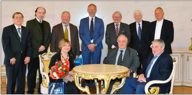
Die Pugwash-Gruppe in der Russischen Akademie der Wissenschaften, Moskau

Aussenminister Russlands Sergei Ryabkov, die Hohe Repräsentantin der UN Izumi Nakamitsu oder Ex-US-Senator Sam Nunn debattierten fünf Tage in Foren, Paneldiskussionen und Arbeitsgruppen zu internationalen Fragen wie z.B. zur Zukunft des Treaty on the Prohibition of Nuclear Weapons, zur Sicherheit in Nordost- und Zentralasien oder zum Frieden in Afghanistan. Ein weiterer Höhepunkt war die Eröffnung der