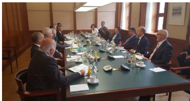
Roundtable mit Außenminister, Sigmar Gabriel und Mitgliedern der Deep Cuts Kommission

Die vom IFSH initiierte und koordinierte Deep Cuts Commission hatte am 16. August 2018 die Gelegenheit Außenminister Sigmar Gabriel und seinem Team in einem Gespräch im Auswärtigen Amt ihre Ergebnisse vorzustellen und zu diskutieren. Die 2013 gegründete Deep Cuts Commission besteht aus 21 Expert/-innen aus Russland, den Vereinigten Staaten und Deutschland und hat drei umfangreiche Berichte sowie diverse Arbeitspapiere zur strategischen Rüstungskontrolle, Abrüstung und Non-Proliferation verfasst und veröffentlicht (siehe < www.deepcuts.org >). Schwerpunkte des Projektes, das vom Auswärtigen Amt und von der Freien und Hansestadt Hamburg unterstützt wird, sind die Zukunft der strategischen Stabilität angesichts neuer militär-technischer Entwicklungen wie der Raketenabwehr, das Fortbestehen des INF-Vertrages und die Weiterentwicklung der konventionellen Rüstungskontrolle. In diversen Arbeitstreffen und Paneldiskussionen in Hamburg, Berlin, Moskau, Washington D.C., Wien und New York wurden die Ergebnisse international präsentiert und diskutiert.