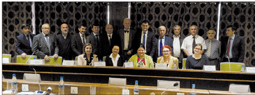
Die Teilnehmer/-innen des Runden Tisches in Duschanbe

Radikalisierungsprävention ist ein aktuelles Thema auf der politischen Agenda Tadschikistans. Religionsfragen spielen in diesem Zusammenhang eine große Rolle in Diskussionen um innere und nationale Sicherheit. CORE und das Zentrum für islamische Studien beim Präsidenten Tadschikistans luden etwa 20 Regierungsbeamte, Wissenschaftler/-innen und NGO-Vertreter/-innen zu einem Arbeitstreffen zu diesem Thema ein.