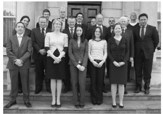
Die Teilnehmer-innen des CORE-Trainings