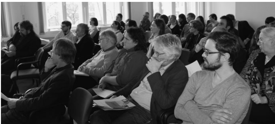
Teilnehmerinnen und Teilnehmer des Workshops „Wege aus der Gewalt“

Unter dem Motto „Wege aus der Gewalt“ fand am 8. Februar 2013 zum vierten Mal ein von IFSH und ZNF organisierter interdisziplinärer Workshop statt, der die aktuellsten Entwicklungen der Hamburger Friedens- und Konfliktforschung vorstellte und Expertisen aus verschiedenen wissenschaftlichen Disziplinen vereinte.