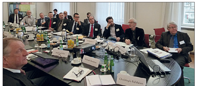
Teilnehmer des KI/LAWS-Workshops im Magnus-Haus in Berlin

Eröffnet wurde der Workshop mit den Grußworten von Botschafter Christoph Eichhorn, dem amtierenden Beauftragten der Bundesregierung für Fragen der Abrüstung und Rüstungskontrolle. Anschließend erläuterte Botschafter Michael Biontino, der ständige Vertreter der Bundesrepublik Deutschland bei der Genfer Abrüstungskonferenz und Botschafter für Globale Abrüstungsfragen, den Teilnehmerinnen und Teilnehmern die Arbeit der Genfer Abrüstungskonferenz und deren Bedeutung in Hinblick auf LAWS. Den weiteren Rahmen des Workshops bildeten vier Panels, deren jeweiliger Themenschwerpunkt durch Fachexpert/-innen inhaltlich eingeführt und von den Teilnehmern diskutiert wurde. Das erste Panel beschäftigte sich mit den aktuellen Forschungstrends der KI-Forschung aus der Sicht der Computerwissenschaften. Im zweiten Panel wurde aus dem Blickwinkel der angewandten F&E über das heutige und künftige, zivile und militärische